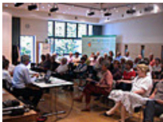
Assemblée générale au Centre de Charles Magne