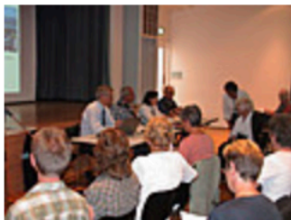
Le comité directeur du S- RLS